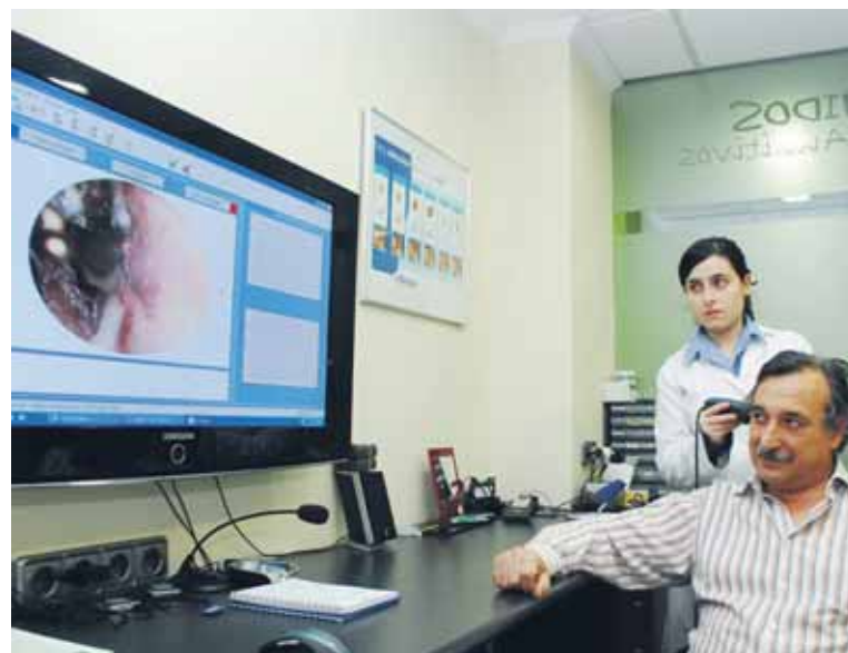
Sonidos Centros Auditivos pone la última tecnología al servicio de sus pacientes.

Sonidos Centros Auditivos abre sus puertas en Cartagena el día 23 de diciembre; el local estará situado en la céntrica Alameda de San Antón (junto a la farmacia 24 horas), atenderá de lunes a viernes, por las mañanas